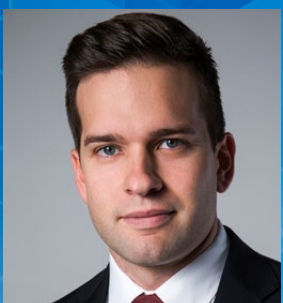
Gabriel Wikström Folkhälso-och Sjukvårdsminister